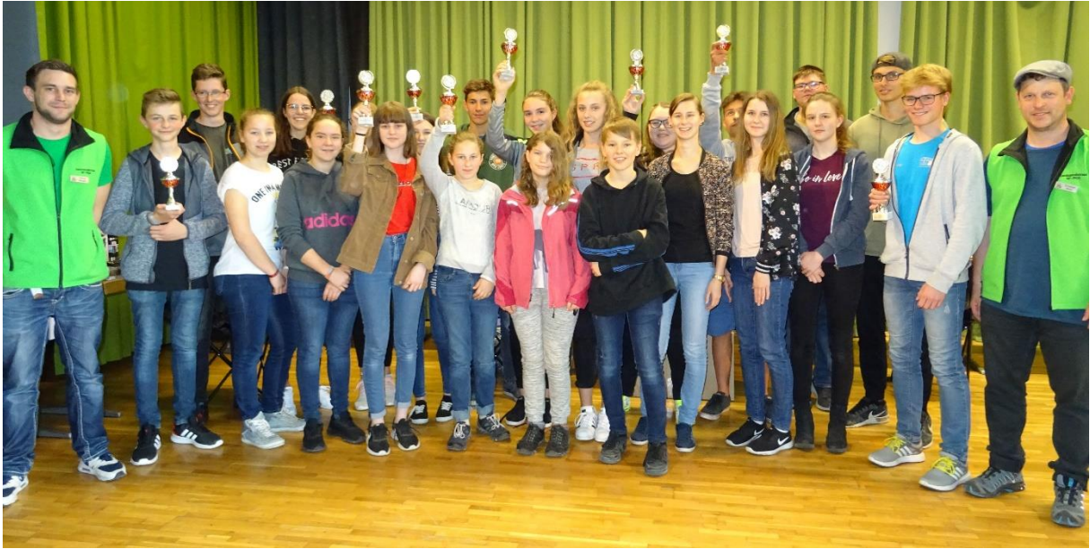
Mannschaftssieger MST 2019